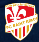
SAINT-RÉMY FC (21)