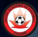
JUVISY ACADEMIE (91)