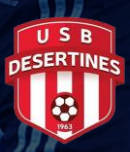
DESERTINES USB (03)