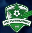
MUIZON ES (BE)