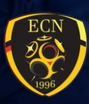
ENT. CHATEL NOYERS (89)