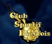
BRAYTOIS CS (77)