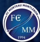
MORTEAU MONTLEBON FC (25)