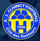
CLAMECY AS (58)