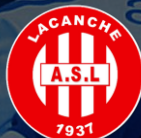
LACANCHE AS (89)