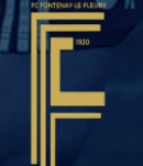
FONTENAY LE FLEURY (77)