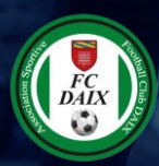
DAIX FC (21)