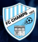
CHAMPS FC (89)