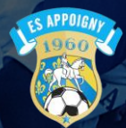
APPOIGNY ES (89)