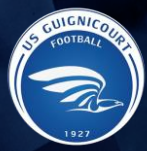
GUIGNICOURT US (77)