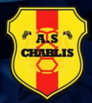
CHABLIS AS (89)