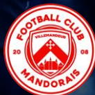
MONDORAIS FC (45)