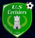
CERISIERS US (89)