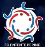
ENT. PEPINSTER (BE)