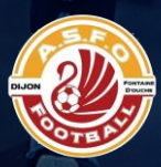
FONTAINE D'OUCHE (21)