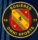
ROSIÈRES OMNISPORT (10)